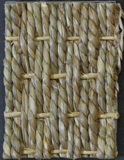
Sea Grass Taiwan