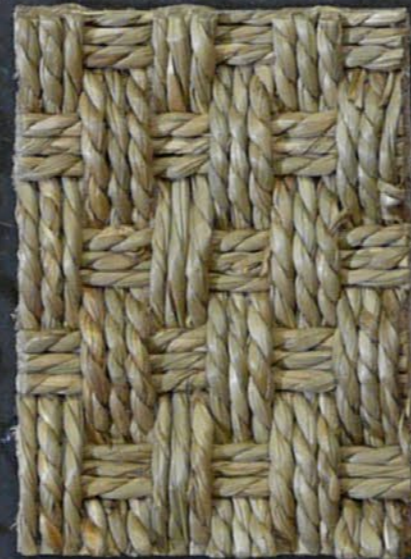
Sea Grass Hilo