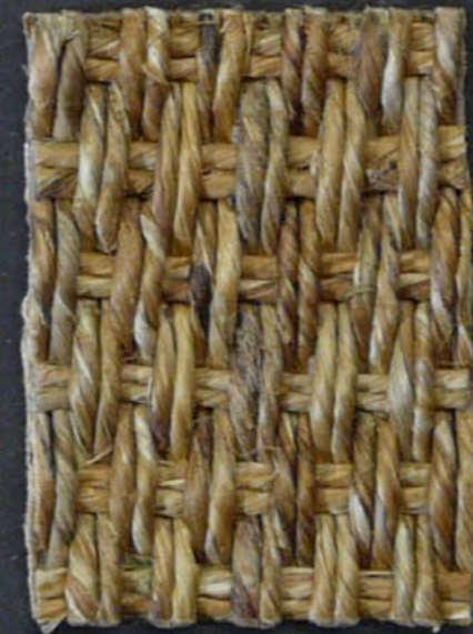
M. Grass Himalaya