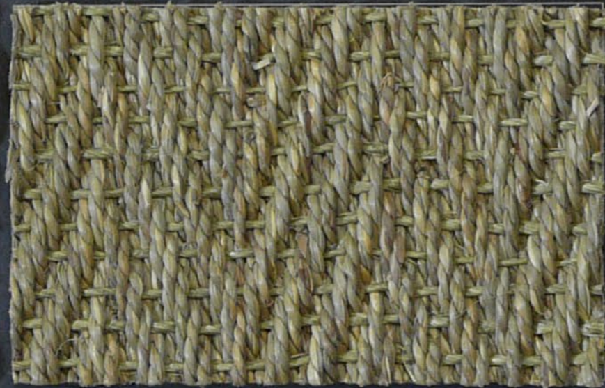
Sea Grass Chevron