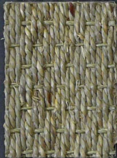
Sea Grass Manila