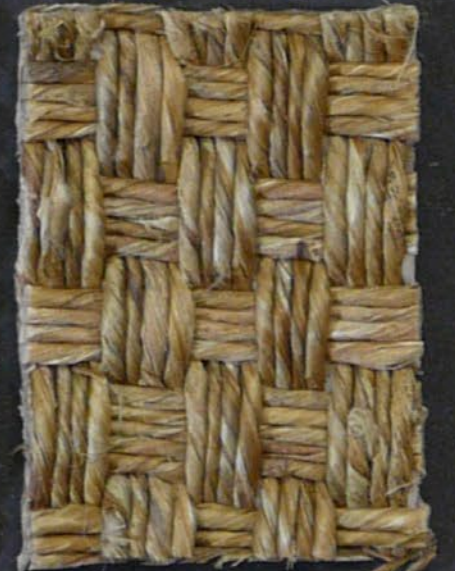
M. Grass Caucaso